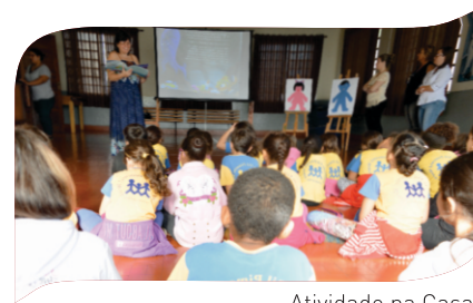
Atividade na Casa da Criança em Lins

Nessa data, no ano de 1973 a menina Araceli Cabrera Sanches Crespo foi assassinada em Vitória, Espírito Santo, num dos mais brutais crimes da história do Brasil. O corpo, desfigurado e com marcas de tortura e abuso sexual, foi encontrado quase uma semana depois, e a data de sua morte, tornou-se o Dia Nacional de Combate ao Abuso e Exploração Sexual de Crianças e Adolescentes, através de lei federal 9.970 sancionada pelo Congresso Nacional no ano 2000.