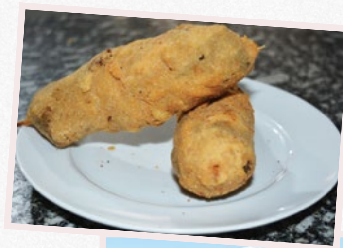
Restaurante Meneghine. Aqui os destaques são o rodízio de carnes e o espetinho de carne empanado

Ao mesmo tempo, estamos certos de que divulgar a gastronomia do interior paulista é um modo de valorizar os hábitos, a história e a cultura da região. Desde a concessão da rodovia, o número de restaurantes aumentou significativamente e hoje é possível encontrar de tudo, desde a mais tradicional culinária caseira, com pratos como frango caipira com quiabo, até o espetinho de peixe, ao lado do Rio Grande, que faz divisa entre os estados de Minas Gerais e São Paulo. Confira a seguir.