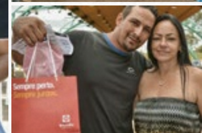
Em homenagem ao Dia do Caminhoneiro, os profissionais atendidos pelo “Sempre Bem Saúde” realizaram exames, receberam orientações para uma vida mais saudável, cortaram o cabelo e levaram para casa kits com brindes da Concessionária

Bem Saúde”. A ação beneficiou, com uma série de atividades voltadas à qualidade de vida e ao bem-estar, cerca de 130 profissionais que passaram pelo pedágio no município de José Bonifácio.