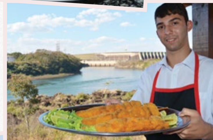
Restaurante Peixe Vivo. Mais de 80 itens entre peixes e frutos do mar