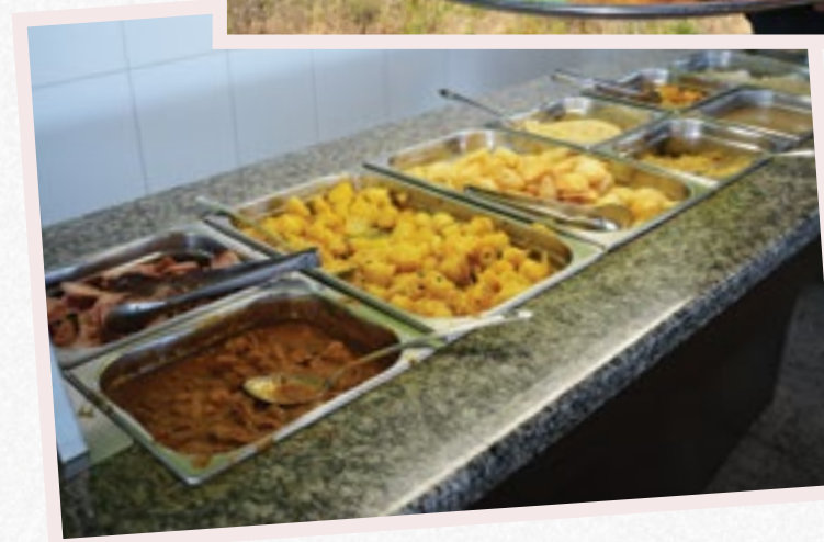
Restaurante e Churrascaria Amigos. Almoço e jantar a preços populares